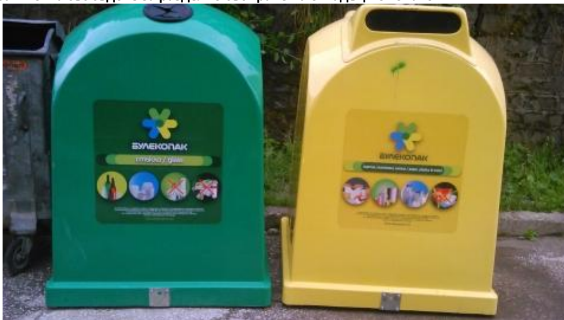
Фигура 2 Точка със съдове за разделно събиране на отпадъци от опаковки

Анализът на данните за постигнатите резултати по отношение на количеството и качеството на разделно събраните отпадъци от опаковки през 2015 г., които са представени в долната таблица не дава основание да се смята, че в рамките само на този договор е възможно да се постигнат нарастващите цели за рециклиране на битовите отпадъци от хартия, метали, пластмаса и стъкло за периода до 2020 г. За това общината трябва да търси и други начини за увеличаване на разделно събраните (при източника) рециклируеми отпадъци.