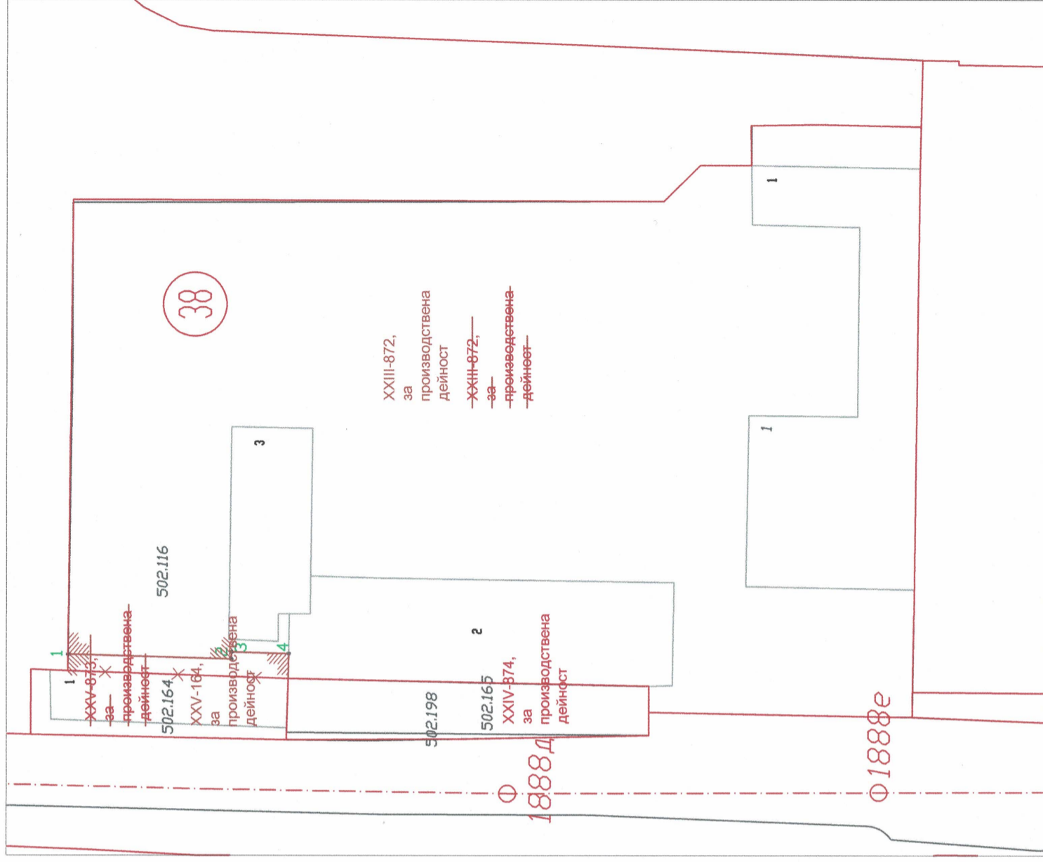
ПРЕДЛОЖЕНИЕ ЗА ИЗМЕНЕНИЕ НА ПР: